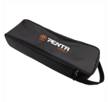
Housse métallisée avec protection CEM